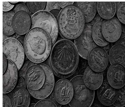
Díaz Ordaz estaba orgulloso del crecimiento económico.